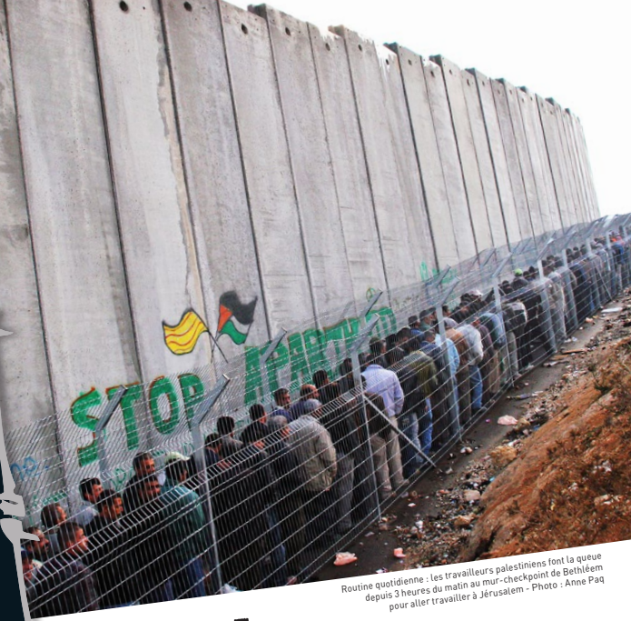
Routine quotidienne : les travailleurs palestiniens font la queue depuis 3 heures du matin au mur-checkpoint de Bethléem pour aller travailler à Jérusalem

Samedi 9 décembre à 14 h 30 Maison des syndicats 12 place des Terrasses Evry