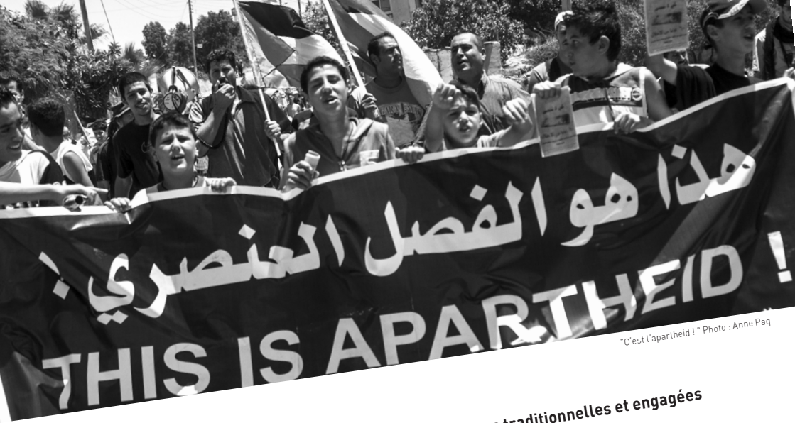
"C'est l'apartheid !"