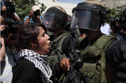
5 juin 2011 / Check point de Qalandiya / Nakba Day / Une jeune Palestinienne scande le slogan "Nous n'avons pas peur ! Nous n'avons pas peur !" devant les soldats israéliens, lors de la commémoration de la Nakba (La défaite / guerre des 6 jours)