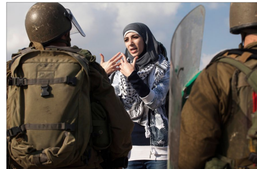
Novembre 2001 / Une militante palestinienne s'adresse aux soldats israéliens lors d'une manifestation contre l'occupation et les colonies, dans le village de Nabi Saleh.