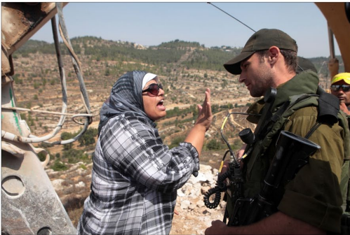
10 / Femmes palestiniennes en résistance