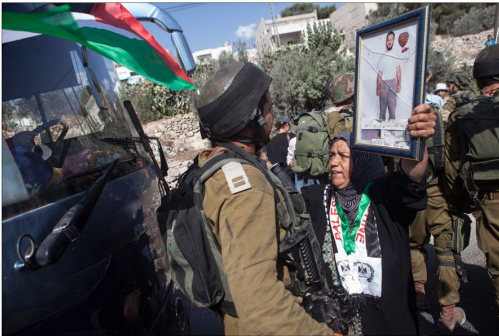
Octobre 2012 / Une femme palestinienne affronte les soldats israéliens et un bus de colons avec une photo de son fils emprisonné, lors de la manifestation hebdomadaire.

02 / Femmes palestiniennes en résistance