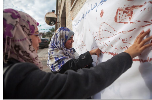
Février 2002 / Pendant un rassemblement en soutien à Hader Adnan, des Palestiniennes inscrivent son nom avec leur sang sur une banderole. Ce jour-là, Hader Adnan, habitant de Jénine, atteignait son 61 e jour de grève de la faim pour protester contre sa détention administrative.