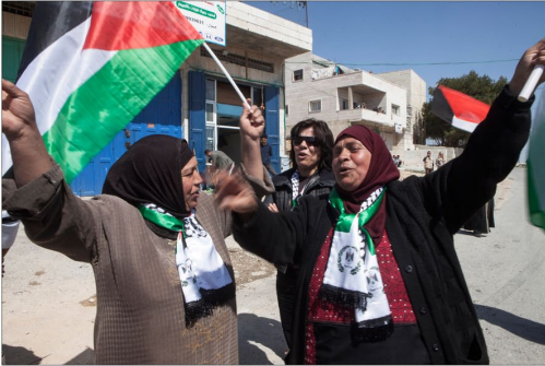
Mars 2012 / Des Femmes palestiniennes chantent lors de la manifestation hebdomadaire dans le village d'Al Ma'sara, situé en zone C.