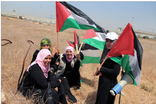
Avril 2001 / Manifestation à Beit Hanoun, dans la "zone tampon" Israël a imposé une zone interdite, le long de la ligne verte, dans laquelle les Palestiniens ne peuvent rentrer sous peine de se faire prendre pour cible. Cette zone représente 35% des terres agricoles de la Bande de Gaza.