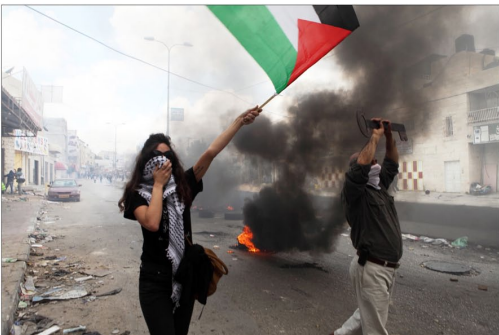
15 Mai 2011 / Camp de réfugiés de Qalandiya / Nakba Day / Une Palestinienne agite le drapeau palestinien lors de la commémoration de la Nakba (la catastrophe / 1948). Le Palestinien à côté d'elle brandit une clé, devenue le symbole de 6 millions de réfugiés palestiniens.