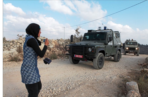
Septembre 2011 / Une jeune palestinienne prend des photos de l'invasion de son village par l'armée israélienne. Les photos prises lors des manifestations, souvent diffusées sur le net, ont valeur de preuve (si agressions physiques) et de témoignage.